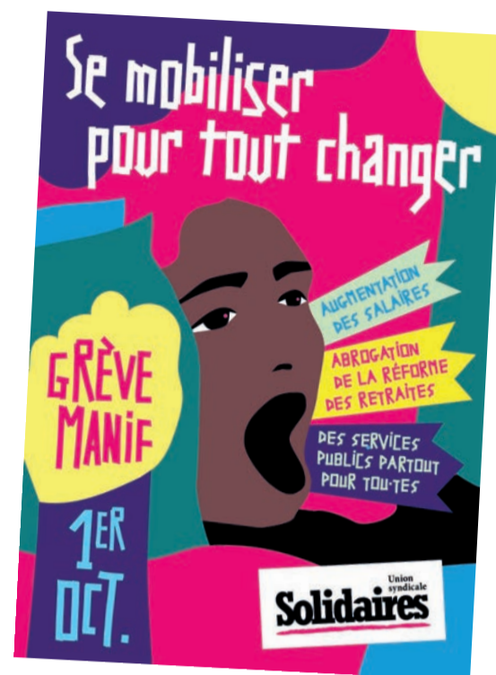
Belle affiche, mauvaise blague. La grandiloquence des bureaucrates de gauche, qui ont mené eux-mêmes chaque lutte à la défaite, notamment celle pour les retraites, ne peut qu'alimenter le cynisme parmi les travailleurs.

L'heure n'est pas à des grandes journées d'action préparatoires à une grève générale. Ce qu'il s'agit de faire, c'est de reconstituer des forces, reconstruire les syndicats sur les lieux de travail en y menant des luttes défensives. Pour qu'elles aient des chances de gagner, cela exige tout d'abord d'avancer des revendications permettant l'unification des travailleurs, comme l'embauche au plein statut et à plein temps de tous les sous-traitants, intérimaires, CDD, etc., l'unification syndicale et le contrôle syndical sur l'embauche. Tout cela va de pair avec de véritables méthodes lutte de classe : caisse de grève préalable, de vrais piquets de grève pour décider les hésitants et dissuader physiquement les jaunes, etc. C'est ce genre de question qu'il faut poser dans les journées d'action pour qu'elles aient la moindre utilité pour les travailleurs,