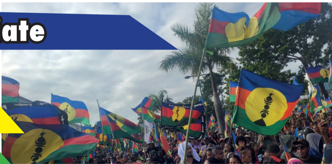
Just One Kanaky

Manifestation contre le dégel du corps électoral à Nouméa, avril dernier.