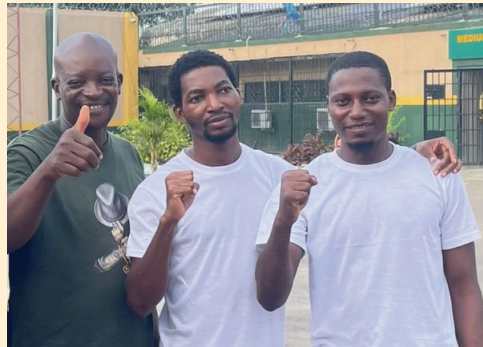
Take it back Movement